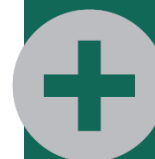
Таблица 2100 «Кроме того, пациенты, переведенные в другие стационары»

Графа 22 «Выписано пациентов – дети» (строка 1 + строка 22)