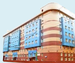
Отдел клинической дерматовенерологии и косметологии