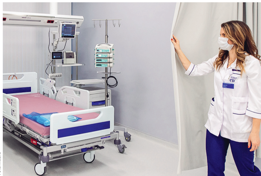
▲ Скорая помощь доставила пациентов