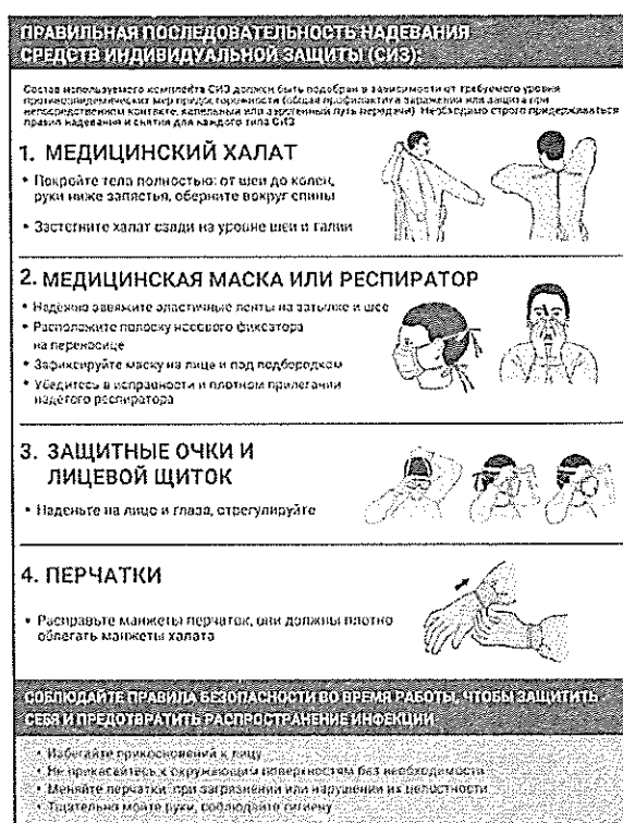
Рисунок 2 – Последовательность надевания средств индивидуальной защиты.

5. Перчатки. Персонал должен надеть две пары перчаток: одна – внутренняя (покрывающая кожу выше запястья, например хирургические перчатки) и одна – внешняя пара перчаток, используемая непосредственно во время работы.