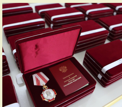
Герои и награды – стр. 2