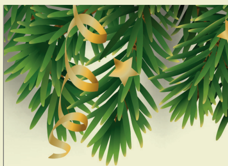
С Новым годом! – стр. 3