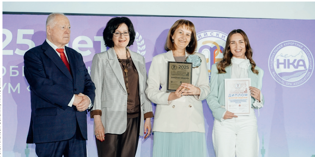
▲ Награждение победителей конкурса