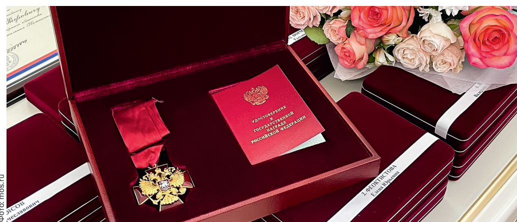
▲ Государственная награда

За высокий профессионализм и самоотверженность, проявленные при оказании медицинской помощи в экстремальных условиях, медалью Луки Крымского