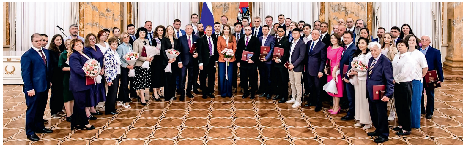
▲ После церемонии награждения